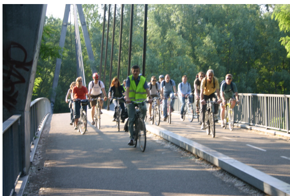
Bus cycliste organisé par l'ADTC (trajet Grenoble – Inovallée)

L'ADTC organise le challenge, gère les inscriptions, propose une affiche et des idées d'incitation, recherche des lots... Ce challenge est aussi une occasion de nouer des contacts avec des entreprises intéressées par des interventions plus concrètes pour amorcer ou compléter leur Plan de Déplacement d'Entreprise (PDE) : mini-stages de remise en selle, actions de prévention du vol, conseils personnalisés sur les itinéraires d'accès au site... C'est pourquoi cette action bénéficie de soutiens multiples : Région Rhône Alpes, Ville de Grenoble, ADEME et Chambre de Commerce et d'Industrie de Grenoble.